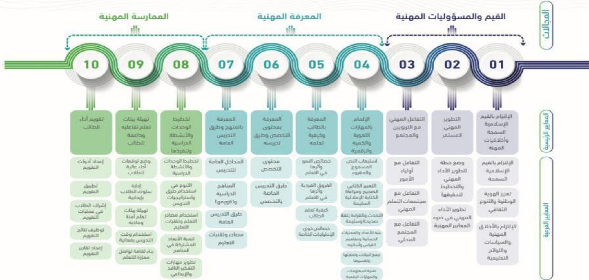
الشكل رقم (4) المعايير المهنية للمعلمين في المملكة العربية السعودية.