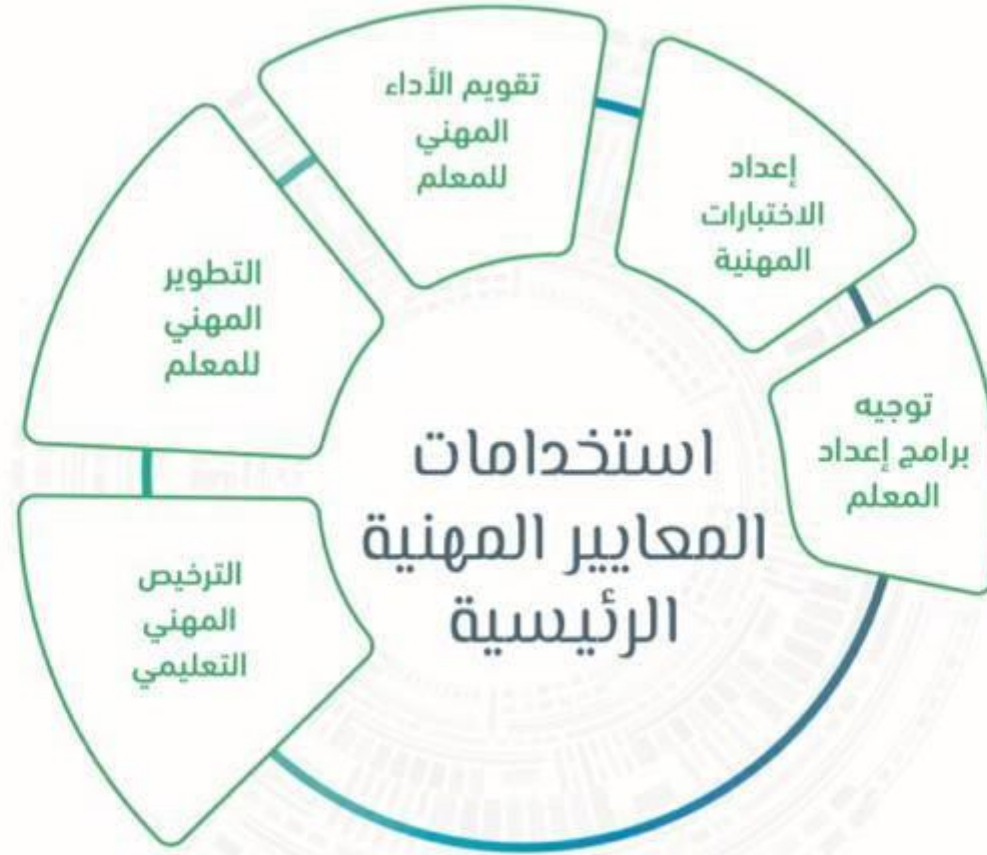
الشكل رقم (2) استخدامات المعايير والمسارات المهنية للمعلمين