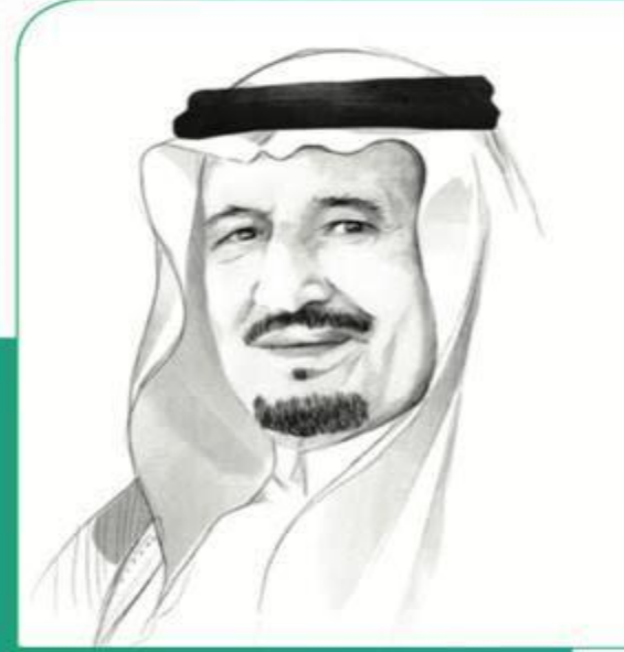
خادم الحرمين الشريفين الملك سلمان بن عبد العزيز آل سعود

”التعليم في السعودية ركيزة أساسية نحقق بها تطلعات شعبنا نحو التقدم والرقيّ في العلوم والمعارف“