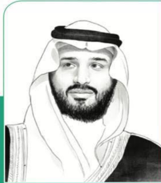
صاحب السمو الملكي الأمير محمد بن سلمان بن عبدالعزيز آل سعود ولي العهد نائب رئيس مجلس الوزراء وزير الدفاع

” طموحنا أن نبني وطناً أكثر ازدهاراً، وطناً يجد فيه كلُّ مواطن ما يتمناه؛ فمستقبل وطننا الذي نبنيه معاً لن نقبل إلا أن نجعله في مقدمة دول العالم، بالتعليم والتأهيل “